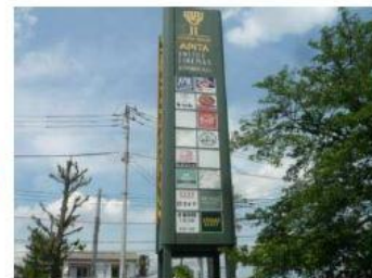
KEYAKI WALK 広告塔